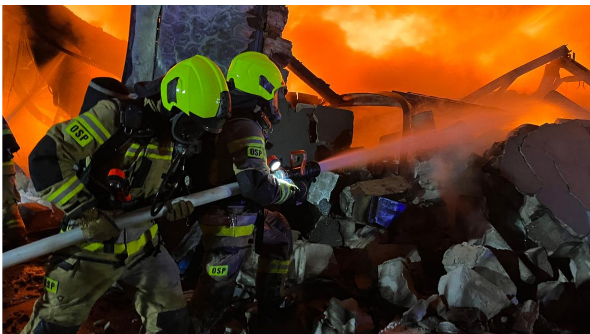
Akcja gaszenia pożaru hali przy ul. Dźwigowej. Na zdjęciu dh. [...] oraz [...]